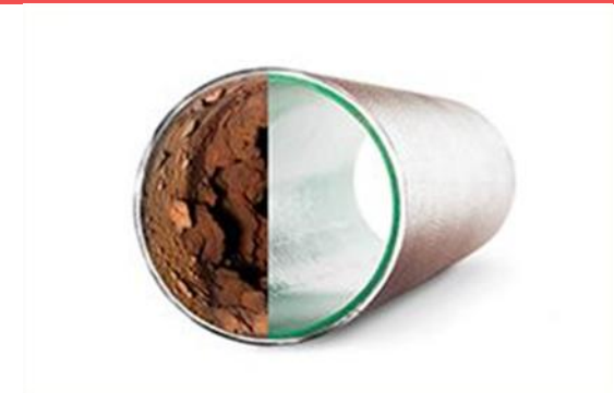
"Nye rør uden byggerod"